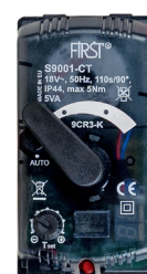
tubra® STM S KR

Stellantrieb STM KR mit integrierter Konstantwertregelung