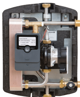
tubra®-nemux S/M mit elektronischer Regelung

Universelle Frishwasserstation mit vielen Möglichkeiten